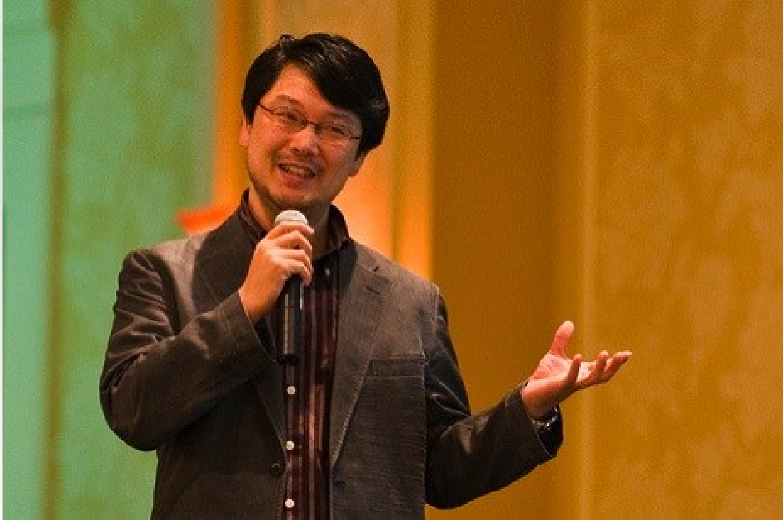
Yukihiro "matz" Matsumoto